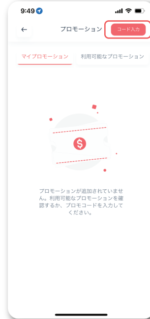
画面右上の「コード入力」をタップ