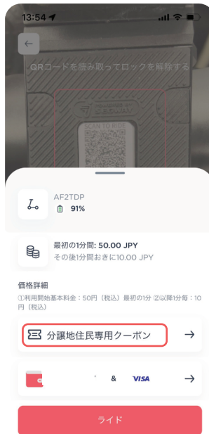
ライド開始時にご利用クーポンの表示を確認