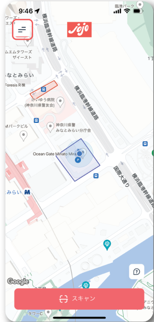
画面左上メニューをタップ

ライド開始前までに、提供されたプロモーションコードを入力することで、住民専用の価格としてライド終了時の料金が割引されます。 右記の手順に従って、利用の準備を済まして、ご利用時のプロモーションの選択と利用後の割引をご確認ください。