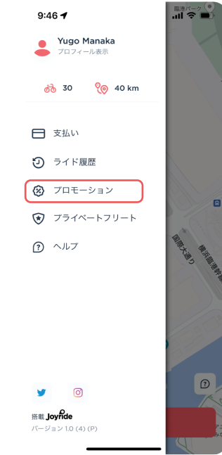
プロモーションをタップ