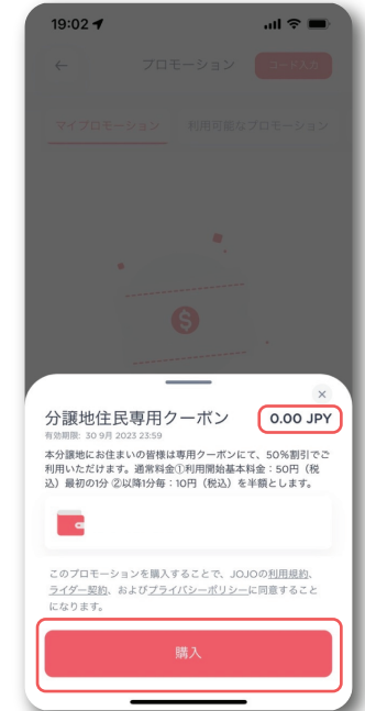
クーポン内容を確認して購入 (0円)