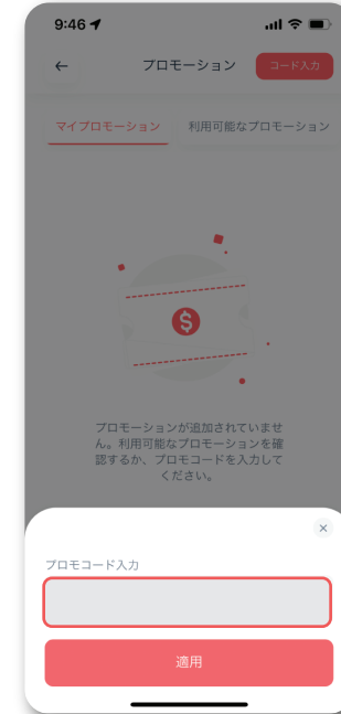
指定のコードを入力