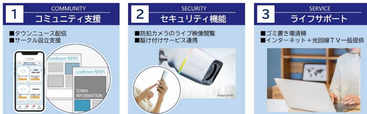
IoT 技術を活用したスマートタウンマネジメント

また、住民専用のスマートタウン向け統合サービス「NiSUMU（ニスム）」を活用した独自のタウンマネジメントを展開。アプリ上での防犯カメラ映像の確認や駆け付けサービスとの連携により、まち全体での防犯性を確保するほか、ゴミ置き場の清掃やタウンニュース配信などの維持管理サービスを提供します。幅広い世代の方が安心、安全かつ快適に生活できる環境をソフト面からもサポートし、まちの魅力の維持・向上に取り組めます。