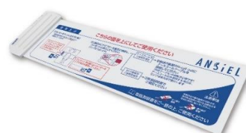
積水化学製高精度起き上がりセンサー「Ansiel」

ステルスヘルスマーター®ニュースリリース https://www.toppan.co.jp/news/2018/12/newsrelease181212_2_.html