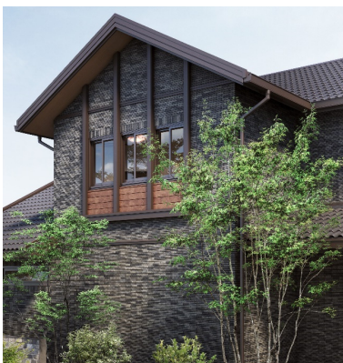
風格のあるファサードデザイン(総タイル外壁)