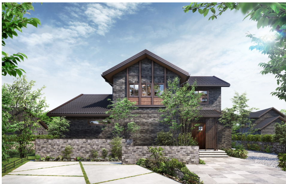
『ザ・デザイナーズ グランツーユー』外観イメージ※1

積水化学工業株式会社 住宅カンパニー（プレジデント：吉田匡秀）は、木質系戸建て注文住宅の新モデル『ザ・デザイナーズ グランツーユー』を、4月19（土）より全国（北海道、沖縄、一部離島を除く）で発売します。