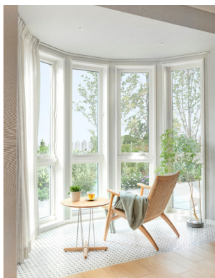
美しい弧を描くボウウインドウ