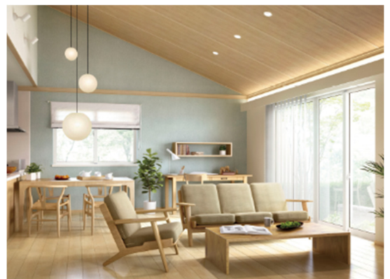
勾配天井を活かした高さのあるゆとり空間