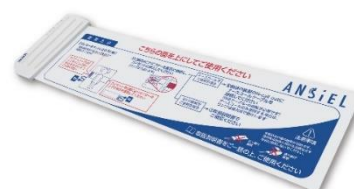
積水化学製高精度起き上がりセンサー「Ansiel」

『ガーデンコート朝霞』では、積水化学工業製の高精度起き上がりセンサー「Ansiel」を入居者様の状態に応じて活用し、転倒事故を未然に回避すると共に、スタッフの心身負担の軽減を図ります。また、共用部には、シー・エイチ・シー・システム株式会社（本社：東京都町田市、代表取締役社長：渋谷俊彦）製の「ニオイ CO 2 デュアルセンサー・コントローラー」を設置し適切な換気を行うことで、冬期の過乾燥を防ぎ疾病を予防します。脱衣室には、凸版印刷株式会社（本店：東京都台東区、代表取締役社長：磨秀晴）が開発した床埋め込み型の体重計「ステルスヘルスマーター®」*を設置、測定時の転倒を防ぎ安全に入居者の健康管理を実施します。さらに、新たなコミュニケーション手段としてオンライン面会も実施、いつでも家族とつながることができます。