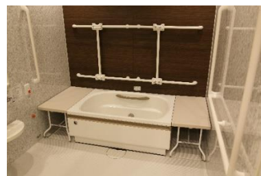
介護・自立支援設備 Wells

『ガーデンコート朝霞』は、「Safe&Sound : 安心・安全で、環境にやさしく、サステナブルなまち」として、積水化学グループの製品・サービスなどを幅広く採用している「あさかりードタウン」の一角にあります。『ガーデンコート朝霞』でも、高精度起き上がりセンサーや介護・支援自立設備 Wells・樹脂製フロア畳 MIGUSA、エスロン給排水管等多数の積水化学グループの製品を採用しています。