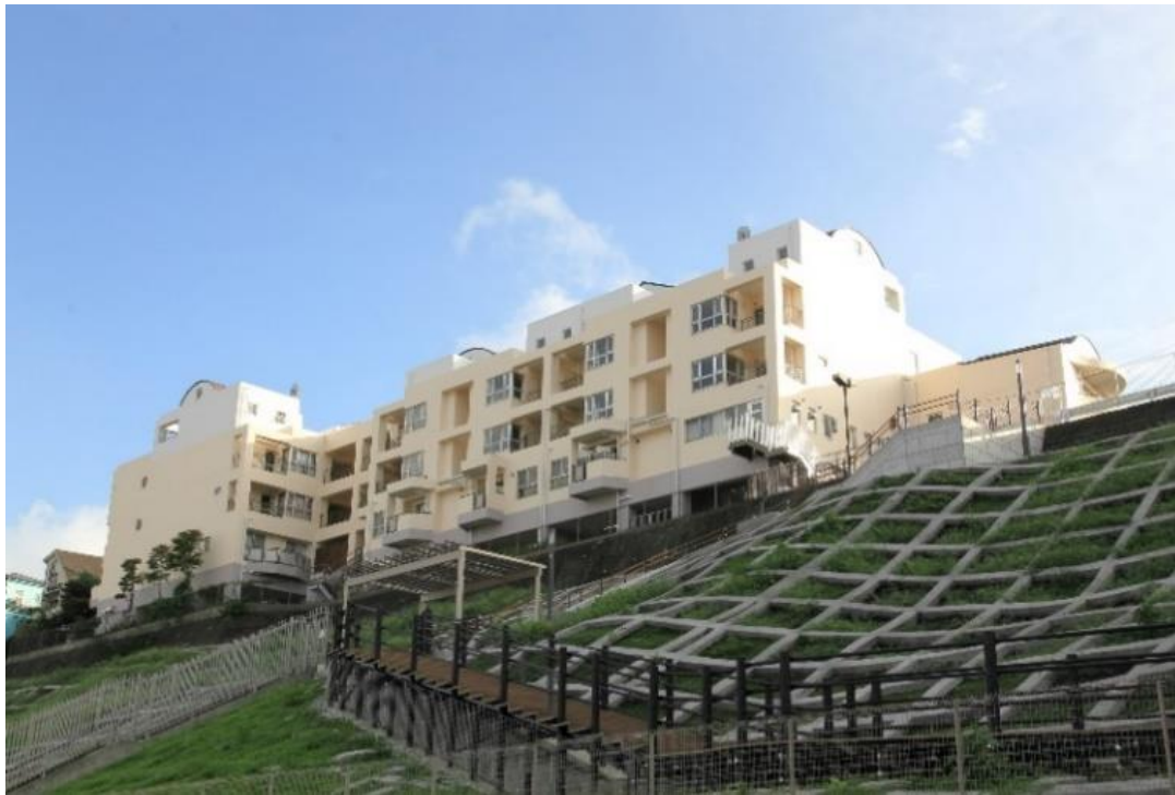
「ガーデンコート朝霞」外観