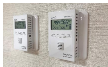
「ニオイ CO 2 デュアルセンサー・コントローラー」

また、ケアの専門技術を持つスタッフが24時間365日常駐し生活全般をサポートします。ケアプラン上の介護保険サービスだけでは補えない不安な点や時間においても、「標準サービス（管理費に包括）」によって専門スタッフが切れ目のない安心な日常をご提供します。