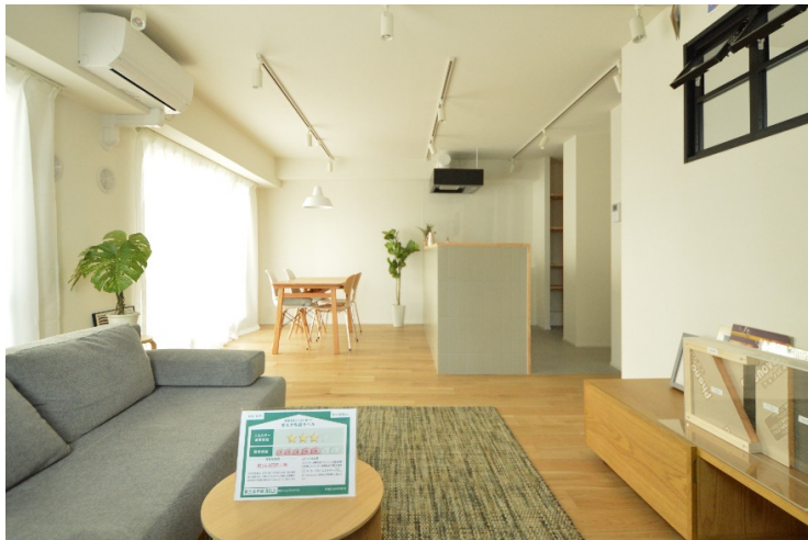
「省エネ性能ラベル」の発行・表示 1号案件「東急ドエル・アルス千住」

「省エネ性能ラベル」の発行・表示 1号案件として、東京都荒川区のリノベーション済みマンションの販売を2024年4月から開始。これは、両社の協業により、省エネ性能を向上させ、BELS 認証「ZEH Oriented」を取得した「ZEH 水準リノベーションマンション」です。省エネ性能ラベルを、不動産ポータルサイトをはじめとした広告媒体に表示するほか、物件内への掲示や、内覧時に消費者への説明も行います。消費者は「エネルギー消費性能」「断熱性能」「目安光熱費」を一目で把握でき、安心して快適な住宅を選択しやすくなります。「省エネ性能ラベル」の発行は、今後両社が協業して ZEH 水準リノベーションを実施する買取再販区分マンションのほか、一棟分譲マンションや一棟賃貸レジデンス、個人向けリノベーション等で対応します。