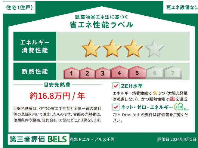
本案件の「省エネ性能ラベル」