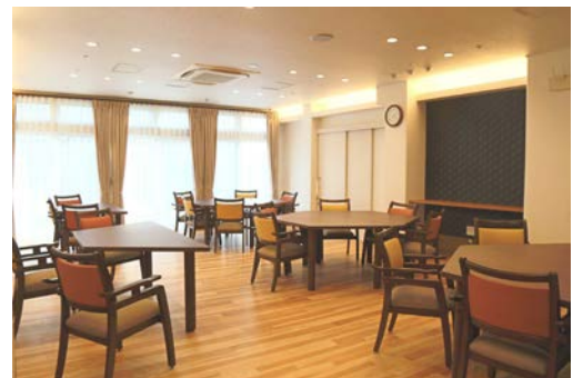
食堂と地域交流スペースがつながり、入居者と地域との交流をはぐくむ。 (食堂奥の白い扉の先が地域交流室)

また、高齢者に限らず地域住民のサークル活動や子ども向けの教室などにも「地域交流スペース」を開放し、多世代交流の拠点とする計画です。『ハイムガーデン南流山』は、地域に開かれたサ高住を目指します。