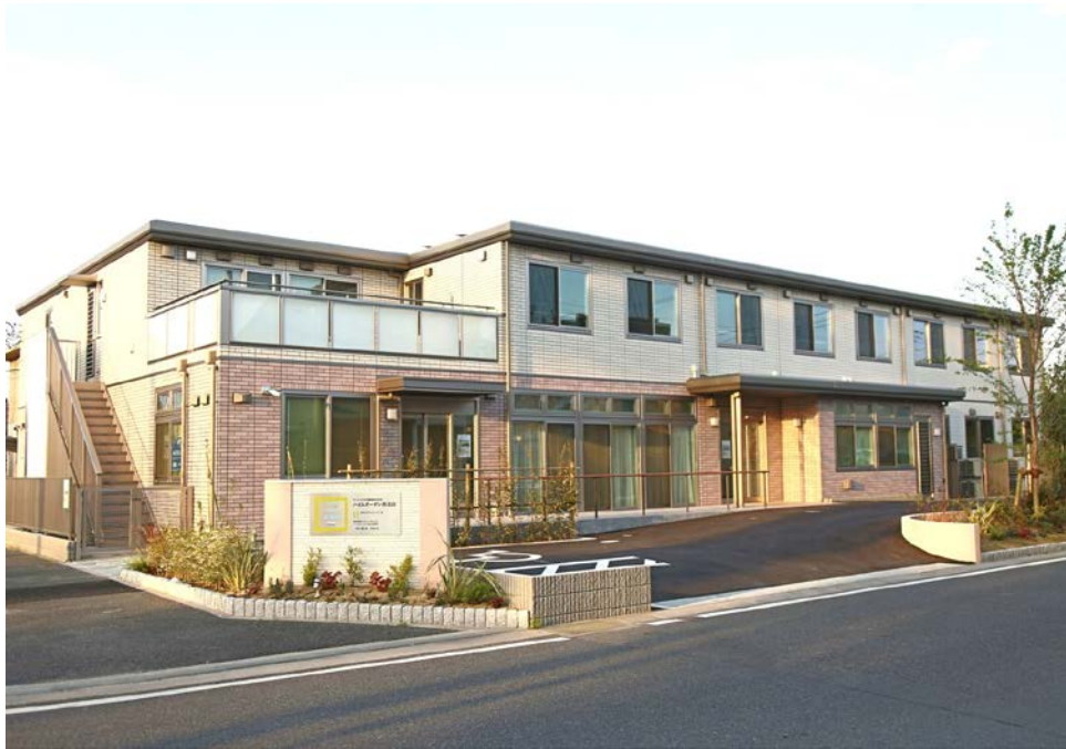
『ハイムガーデン南流山』外観