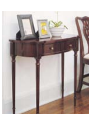
▲ コンソールテーブル

トイレは家の中でも使用頻度の高い場所。毎日、目にするこの空間は、 家族の写真の展示室としてもこのスペースです。顔のアップ、ペット、街で 見かけた風景などを小さな額に入れて飾れば、家族の楽しさが伝わる展示室 になります。左の写真のようにカラーボードを額に見立てて写真を貼り付け、 シールなどで手づくり感を出すのも素敵。狭い場所なので、大きな額は圧迫感 を与えるのでNG。少し大きめの写真を中心に、まわりを小さな額で 囲むようにして、まとまりをつくって飾るのがコツです。